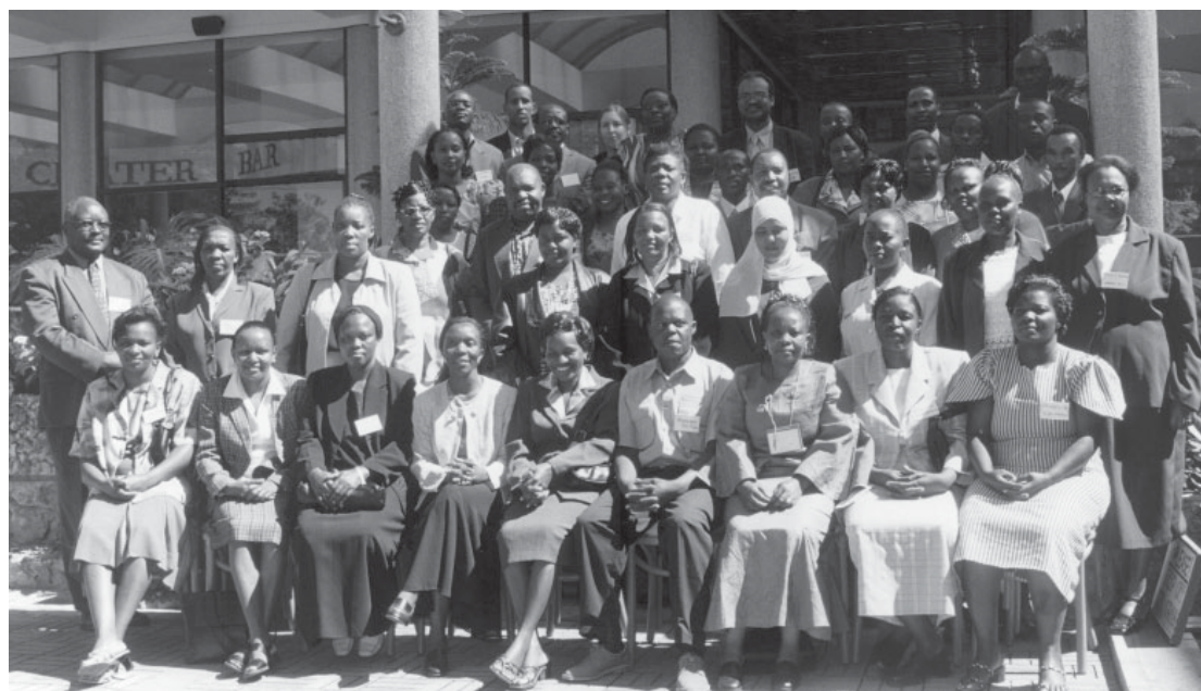
Nakuru, Kenya 21-22.4.2005 Participants à l'atelier national pour promouvoir Postinor 2 dans le secteur public. Participants at national workshop to reintroduce Postinor 2 in the public sector.

Today, stocks of Postinor 2 are available at all public health facilities, youth friendly centers, and in a series of newly established sexual assault and rape clinics. Plans are now underway to make available the new stocks of EC to recognized non-governmental health facilities.