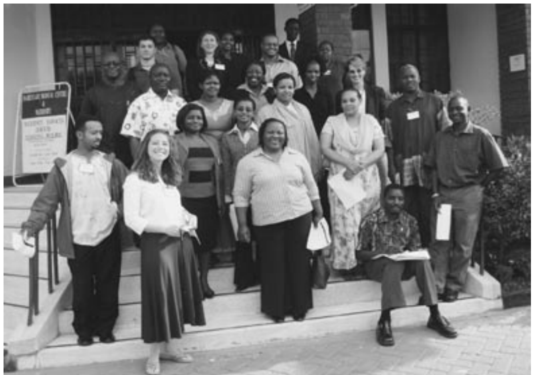
Picture caption Participants of the Journalist to Journalist workshop during a visit to the Family Health Options Clinic in Nairobi

Vingt-deux grands reporters sur la santé venus du Kenya, d'Ethiopie, d'Ouganda, de Tanzanie et du Malawi ont été choisis pour prendre part à cette formation de quatre jours, qui a immédiatement précédé la deuxième Conférence Africaine sur la Santé et les Droits en Matière de Sexualité. Lors de cette conférence, les participants ont pu tester les connaissances qu'ils venaient d'acquérir, sous la direction de rédacteurs en chef de haut niveau, préparer des rapports pour leurs journaux respectifs et rédiger des articles pour le bulletin de la conférence. Une activité du même genre est actuellement en préparation pour les journalistes francophones d'Afrique de l'Ouest.