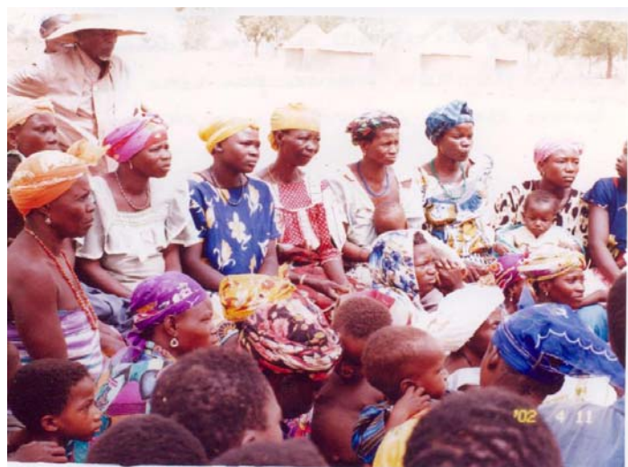
Réunion de sensibilisation des exciseuses et ex-exciseuses