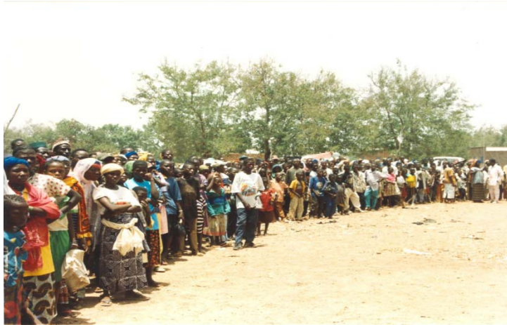
les villages environnants venus assister à la déclaration