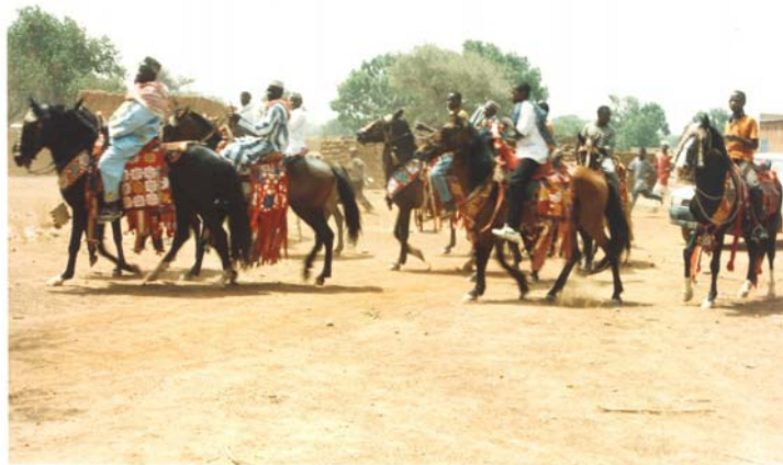
Arrivée du Moro Naba 11 à la cérémonie de déclaration publique

A la fin du programme, une cérémonie de déclaration publique d'abandon de l'excision a eu lieu à Béré, chef lieu du dit département le 03 mai 2003. Cette cérémonie a regroupé les 23 villages couverts par le programme, mais aussi beaucoup d'autres personnes venues des villages environnants. On peut noter également la présence effective des chefs coutumiers et religieux de la zone. Elle a surtout été marquée par la déclaration faite par une femme au nom de toutes les communautés et le geste rituel du représentant des chefs coutumiers qui valide l'engagement pris d'abandonner la pratique de l'excision.