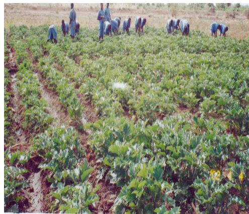
Les filles du projet mille jeunes filles apprenant le maraîchage

Outre l'attestation de fin de formation, chaque fille reçoit une dotation en équipement correspondant à son domaine de spécialisation et un carnet d'épargne avec la somme de 120 000 FCFA. Cette somme correspond en fait à une épargne de 10 000 FCFA effectuée durant les deux ans sur le pécule mensuel qui était alloué à chaque fille.