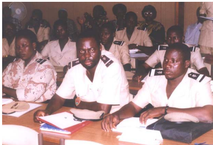
Formation de la brigade de gendarmerie en vu des patrouilles de sensibilisation et de dissuasion

A l'origine "la Patrouille" est une mission militaire donnée à une équipe légère motorisée ou pas, en vue de se porter isolément et en sûreté dans une zone donnée pour y accomplir une mission déterminée, regagner son point de départ et rendre compte. Ce concept a donc été adapté par les Brigades de Gendarmerie au contexte de la lutte contre la pratique de l'excision, de sorte que la patrouille de sensibilisation et de dissuasion se définit comme étant un ensemble d'activités spécifiques menées par les Gendarmes dans le cadre de la lutte contre la pratique de l'excision.