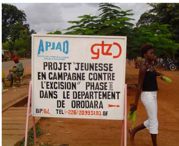
L'Association Pour la promotion de la Jeunesse Africaine et le Développement

Cette approche a été expérimentée avec une association de jeunes qui est l'APJAD (l'Association pour la Promotion de la Jeunesse Africaine et le Développement). Cette association dont le siège est à Ouagadougou travaille avec les jeunes dans la province du Kéné Dougou.