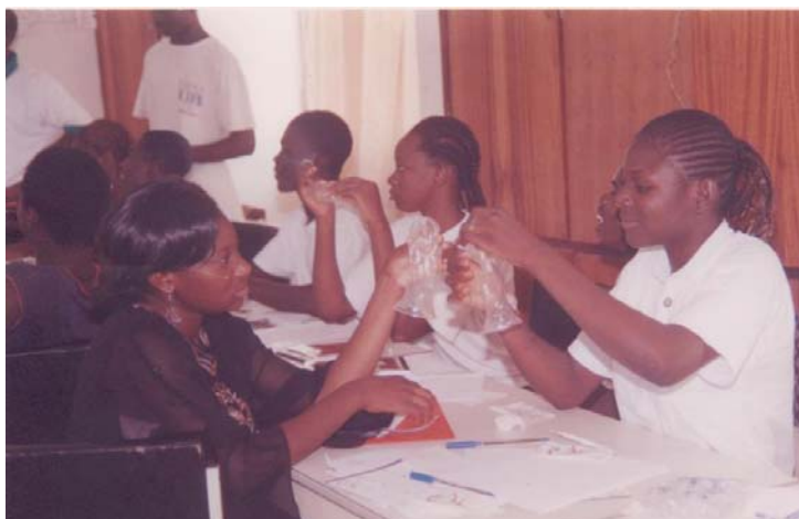
Formation des jeunes de l'APJAD en santé de la reproduction

Pour ses activités de sensibilisation, l'APJAD considère les filles et garçons de 7 à 19 ans comme public cible prioritaire, leurs parents comme cible secondaire. Mais des personnes adultes influentes telles que des leaders communautaires et des autorités administratives locales ont été mobilisés pour apporter leur soutien à la promotion de l'abandon de l'excision.