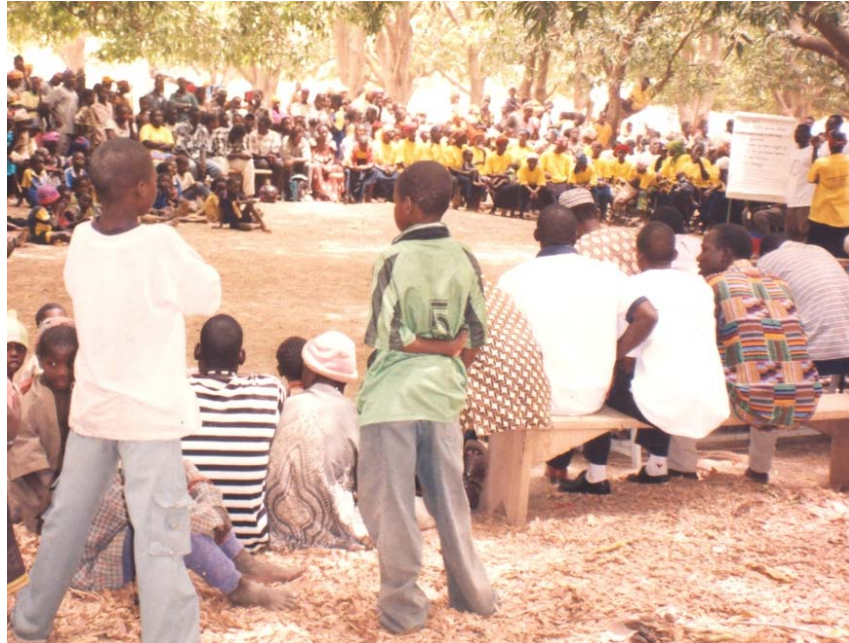
Une réunion inter-villageoise

A la fin du programme, une cérémonie de déclaration publique d'abandon de l'excision a eu lieu à Béré, chef lieu du dit département le 03 mai 2003. Cette cérémonie a regroupé les 23 villages couverts par le programme, mais aussi beaucoup d'autres personnes venues des villages environnants. On peut noter également la présence effective des chefs coutumiers et religieux de la zone. Elle a surtout été marquée par la déclaration faite par une femme au nom de toutes les communautés et le geste rituel du représentant des chefs coutumiers qui valide l'engagement pris d'abandonner la pratique de l'excision.