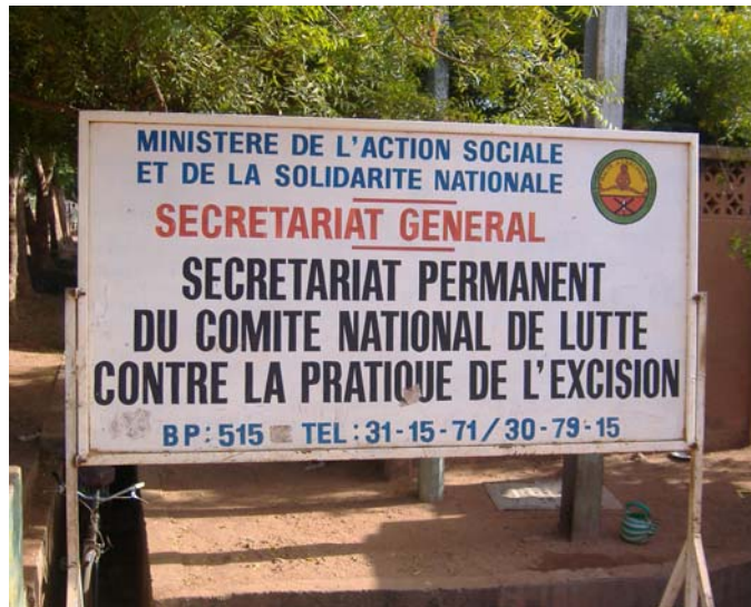
Siège du Secrétariat Permanent