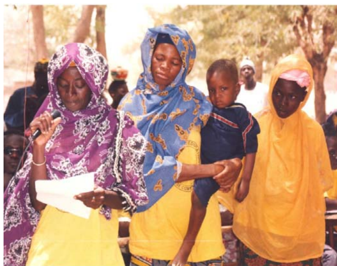
Les femmes lisent leur déclaration d'abandon de l'excision