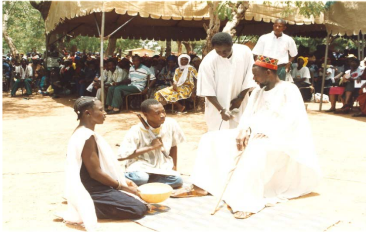
Sketch de sensibilisation sur les méfaits de l'excision