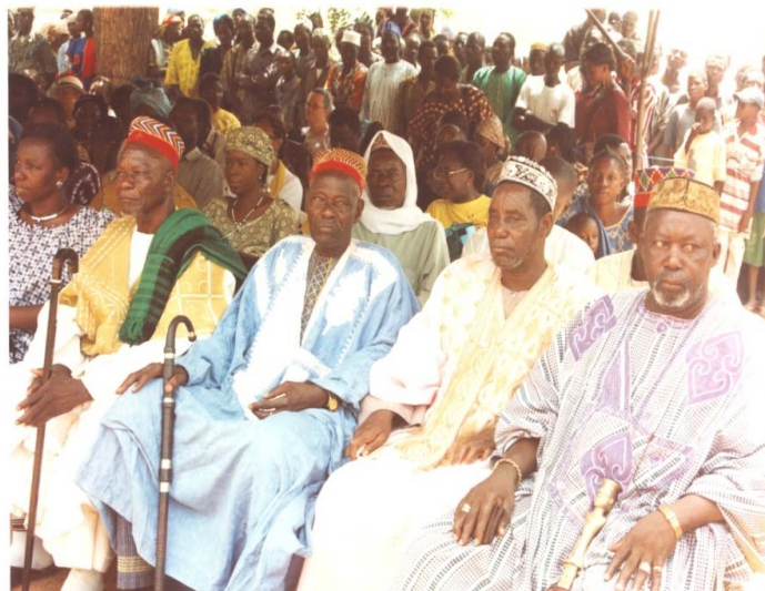
Participation des leaders religieux