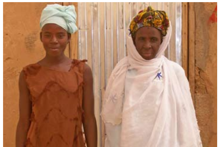
Cette jeune femme a évité un mariage avec un homme âgé de près de trois fois son âge parce que sa mère a contesté la pratique traditionnelle.

L'existence d'un environnement social favorable est essentielle pour changer les normes sociales et lutter contre le mariage précoce. L'équipe du projet a fait participer directement les personnes chargées de prendre les décisions au nom des adolescentes, tels que les pères,