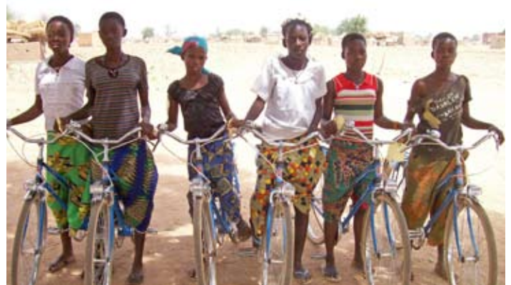
Les filles scolarisées ont obtenu des bourses et des bicyclettes pour les encourager à poursuivre leurs études.

Les travaux de recherche du Population Council ont révélé que les filles mariées burkinabé souffraient de contraintes liées à leur temps libre, à leur liberté de mouvement et au manque d'accès aux centres de santé. Le seul moyen d'intervenir dans cette population est de les toucher à leur domicile. Ces résultats ont orienté l'élaboration d'une intervention novatrice connue sous le nom de Programme des « mères-éducatrices ». Le rôle principal de mères-éducatrices a été de fournir des informations et un soutien aux adolescentes mariées au cours de leur première grossesse et accouchement, et d'apporter des suppléments de vitamine A et de fer à celles qui étaient enceintes. Compte tenu de l'isolement des adolescentes mariées, les mères-éducatrices voyageaient en paires (au moyen de bicyclettes fournies par le projet) au domicile des filles vivant dans les zones reculées ; une mère-éducatrice discutait avec le chef de famille en lui expliquant le programme et en fournissant des informations, alors que l'autre mère-éducatrice tentait d'établir un dialogue avec l'adolescente mariée. Pour accroître l'utilisation des centres de santé locaux, les mères-éducatrices ont joué un rôle de liaison entre les adolescentes mariées et le personnel des