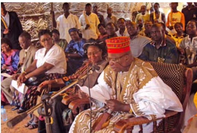
Séance de plaidoyer avec le roi de Boussouma encourageant le respect de l'âge légal du mariage, qui est de 17 ans pour les femmes et de 20 ans pour les hommes.

Ce programme pilote a recruté des mères-éducatrices pour servir de tutrices aux jeunes filles à risque de mariage précoce. Pour être admissibles, les mères-éducatrices devaient avoir entre 15 et 19 ans, être mariées avec au moins un enfant et être bien considérées dans leurs communautés. Les mères-éducatrices ont été formées aux droits