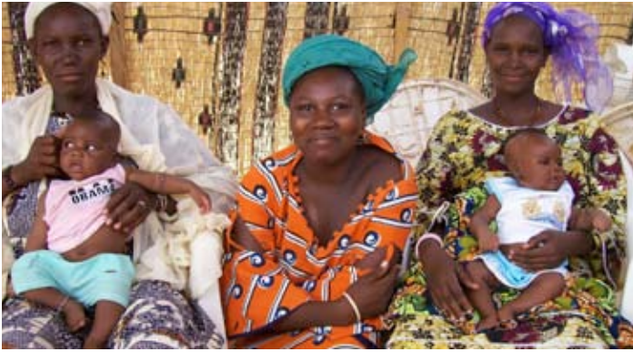
Trois mères-éducatrices à Dori (région du Sahel) qui ont servi de tutrices et des filles qui ont été informées sur les risques liés au mariage précoce et sur la santé reproductive.

celles qui sont déjà mariées. Le projet a souligné le rôle de la communauté pour appuyer et plaider en faveur du retard de l'âge du mariage. Le projet s'est déroulé dans 24 villages à travers cinq régions (Centre-Sud, Centre-Est, Est, Centre-Nord et Sahel).