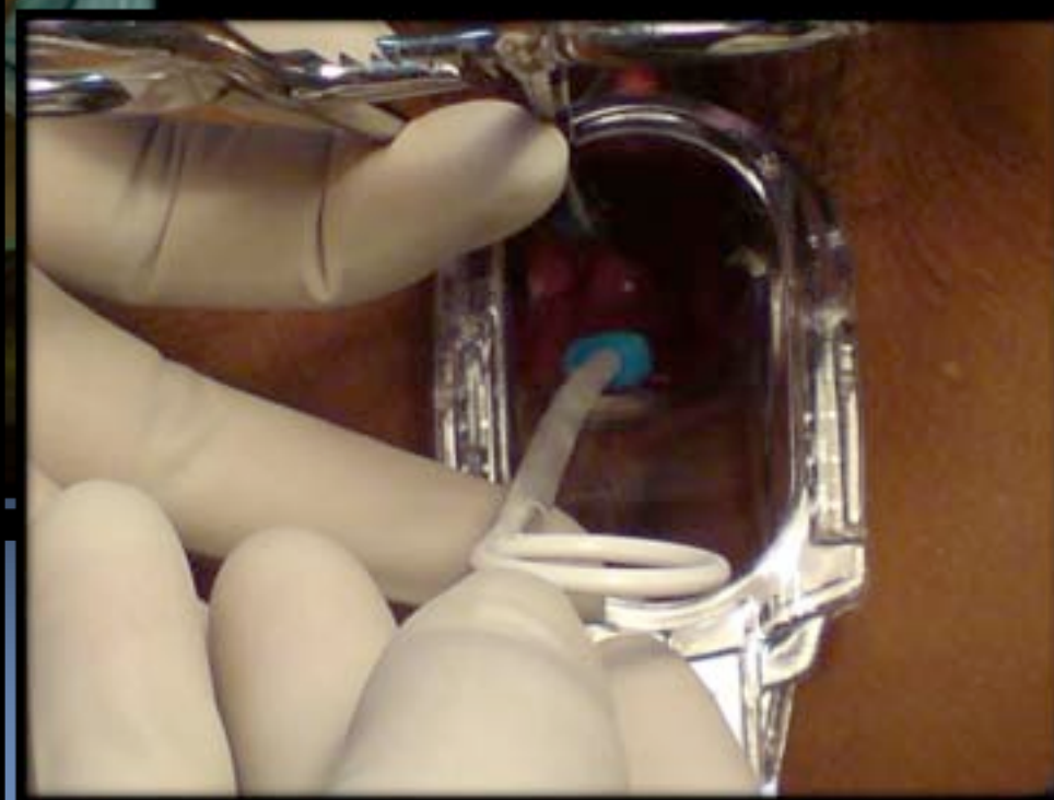
Inserción del DIU