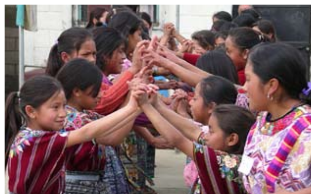
Le programme Abriendo Oportunidades crée des espaces sécurisés et met des tutrices à la disposition des jeunes filles Maya.

L'intérêt particulier porté aux adolescents par le Population Council date des années 1990 et s'accompagne d'un engagement à ouvrir le champ des études et des programmes consacrés aux adolescents en élargissant le simple domaine de la sexualité, de la santé génésique et des comportements aux grandes questions sociales et économiques qui sous-tendent la santé et le bien-être des adolescents.